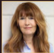
OONA HORX STRATHERN AT & IRE FUTURIST & AUTHOR